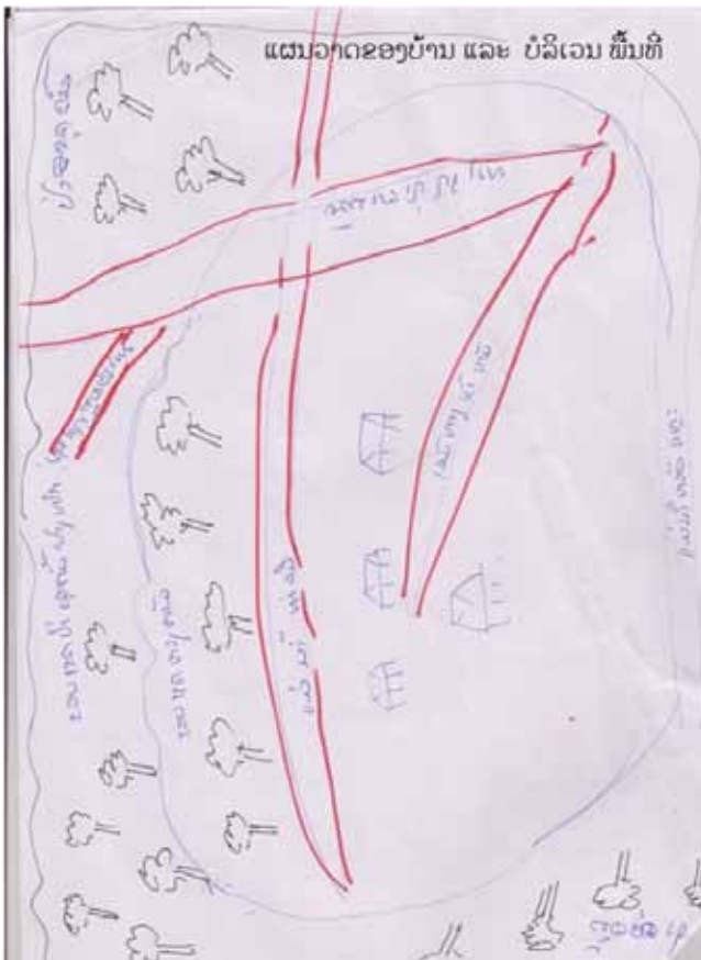
ຊາວບ້ານກຳລັງຖືອຸປະກອນການກີດຢາງເບື້ອງຂວາແມ່ນມີດກີດ ສ່ວນເບື້ອງຊ້າຍແມ່ນກະປ່ອງໃສ່ຫລີໂຕ່ງຢາງແປກ