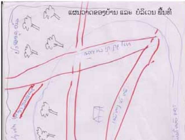
ອຸປະກອນກີດຢາງແປກ