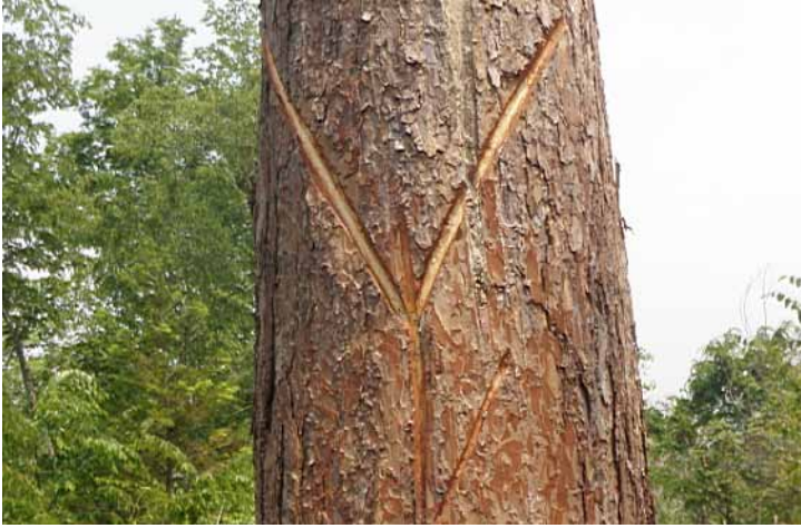
ຖົງຢາງ ຫຼື