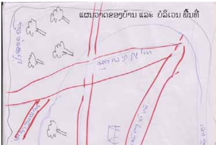
ຢາງແປກທີ່ກັ້ນໄດ້ມາໃຫມ່ເປັນ ສີຂາວ ແລະ ໜຽວ