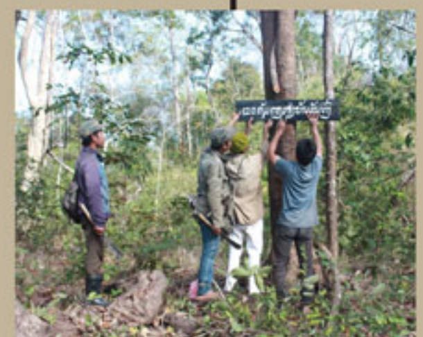
ການຄຸ້ມຄອງປ່າໄມ້ແບບຍືນຍົງ