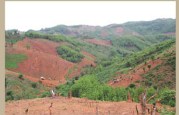
ການເຮັດໃຫ້ປ່າໄມ້ເສື່ອມໂຊມ