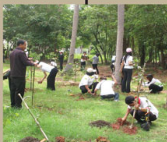
ຂະຫຍາຍພື້ນທີ່ການເກັບຮັກສາກາກບອນ