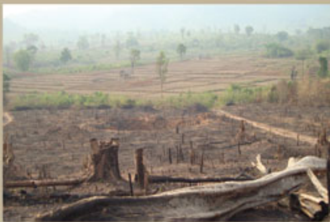
ການທຳລາຍປ່າໄມ້

ບັນດາປະເທດຮຸ່ງມີ ແລະ ມີການ ພັດທະນາທາງດ້ານອຸດສາຫະກຳ (ປະເທດພັດທະນາແລ້ວ)