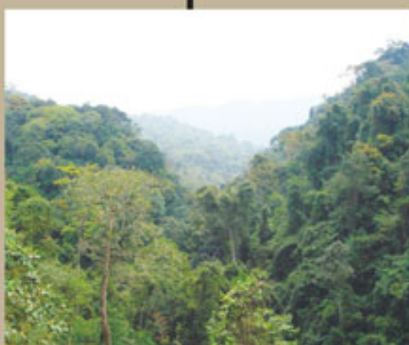
ການອະນຸລັກປ່າໄມ້